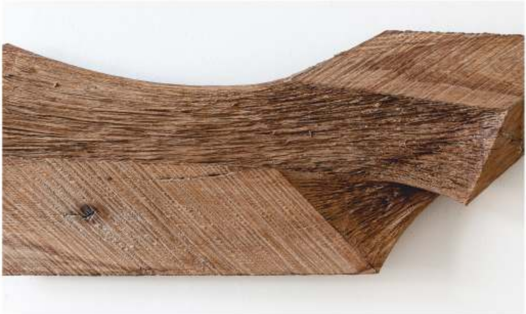
Oben: Absperrband 13/07 (Detail), Installation im Liebenweinturm Burghausen Unten: Eiche 19/05 (Detail), 25 x 76 x 12 cm, 2019