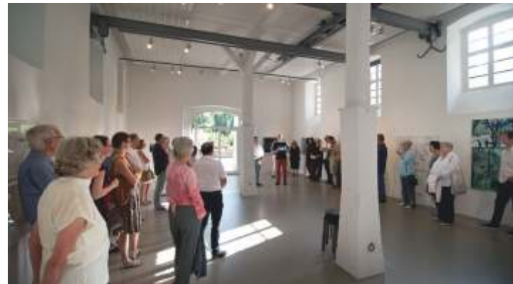
Bilder einer Sammlung – Kunstankäufe der Stadt Mosbach